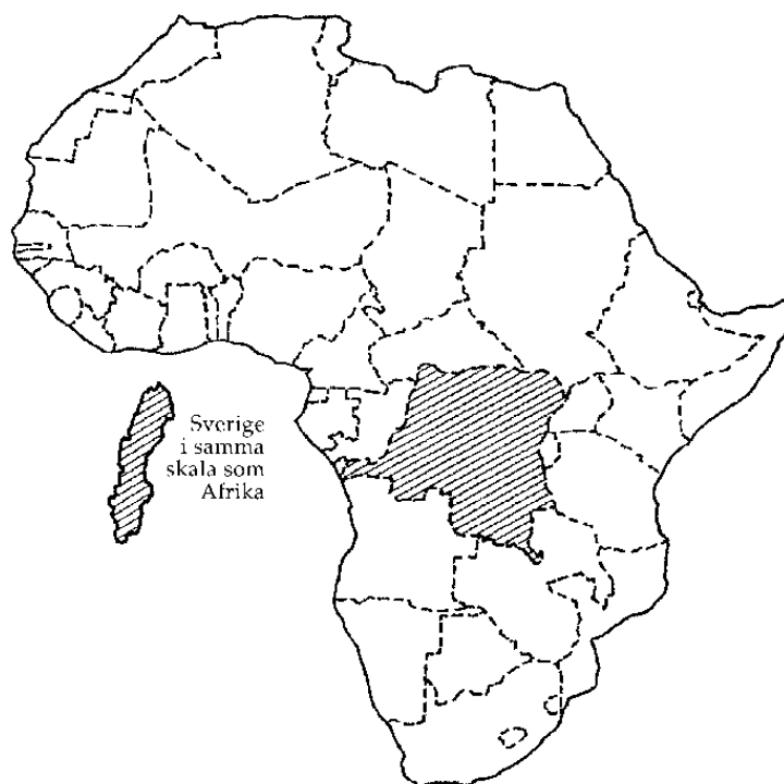
Kongos läge i Afrika.

År 1971 genomfördes en namnreform, då orter m.m ändrades till deras nuvarande namn. I denna uppsats används uteslutande de namn som användes vid den aktuella perioden, d.v.s innan denna namnreform. Innan reformen förväxlades lätt Republiken Kongo med grannlandet i väster, det f.d Franska Kongo, ofta kallat Kongo-Brazzaville, numera Folkrepubliken Kongo. De nuvarande benämningarna redovisas i listan nedan.